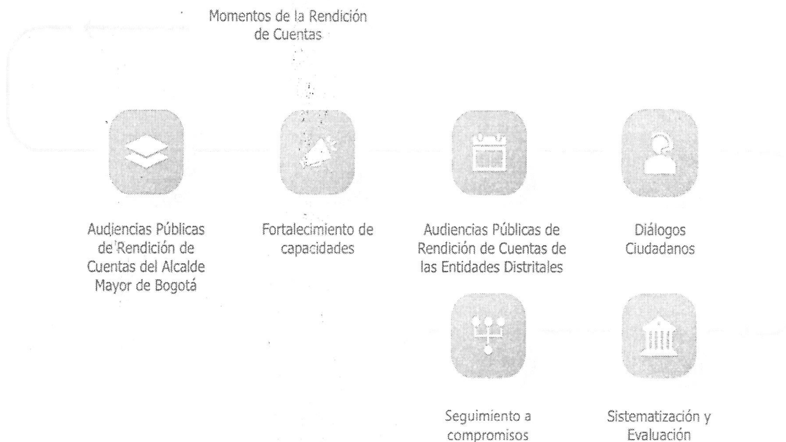
Figura 2. Momento de la Rendición de Cuentas

Este proceso contiene seis momentos, así: